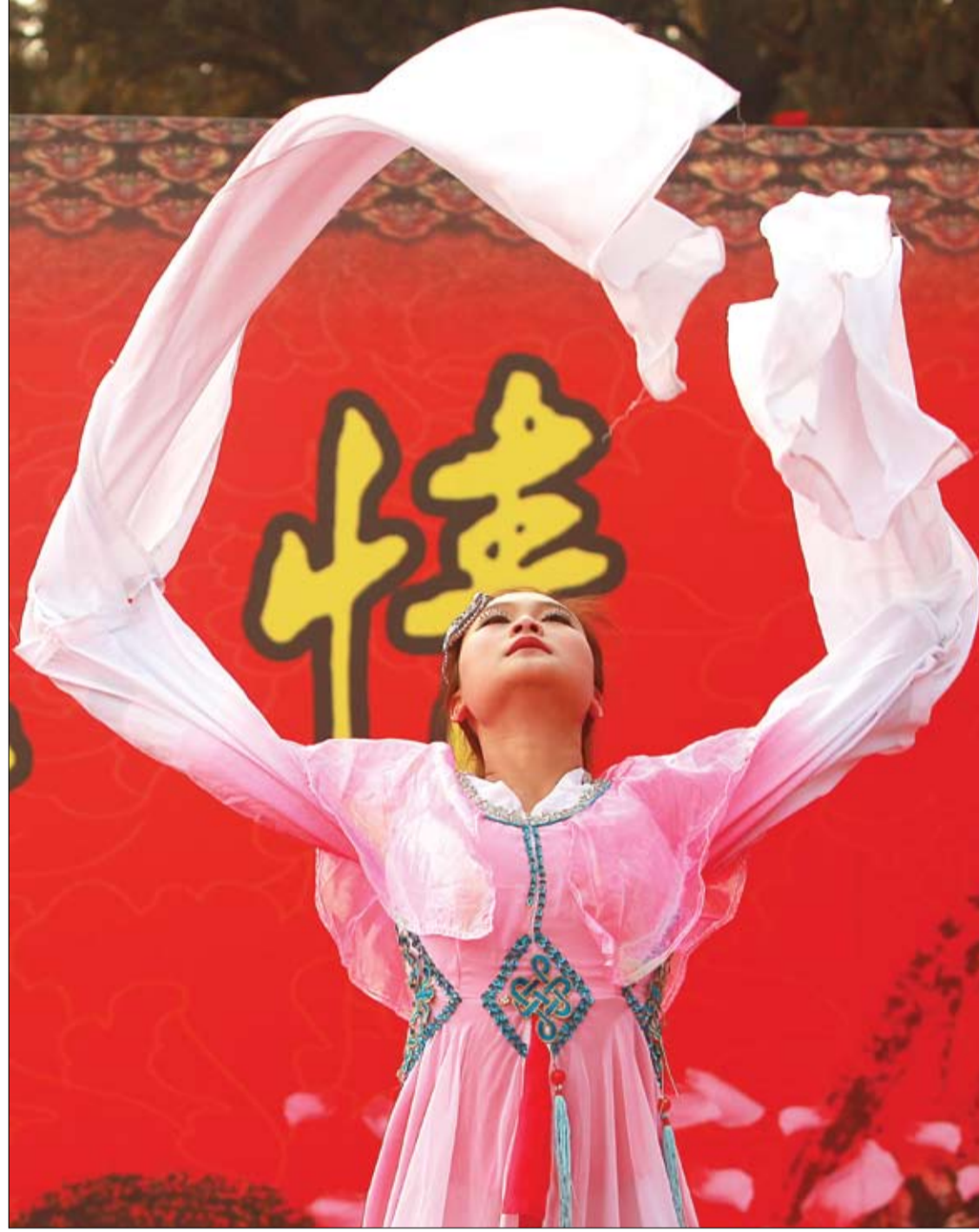
راقصة تؤدي عرضاً في ختام مهرجان الربيع الصيني احتفالاً بالعام القمري الجديد والمسمى بعام الأفعى

حذرت المؤسسة الأوروبية لأبحاث الحساسية في برلين مرضى الربو من تدفئة غرف المعيشة أو أماكن العمل بشكل زائد عن الحد خلال فصل الشتاء، حيث تتسبب درجات الحرارة العالية في جفاف الهواء بدرجة كبيرة، ما يؤدي إلى جفاف الأغشية المخاطية المبطن للأنف، الأمر الذي يتسبب في تهيج المسالك التنفسية المصابة. وتنصح المؤسسة بضبط جهاز التدفئة على درجة حرارة لا تزيد على 20 درجة مئوية، مع الحرص على تهوية المنزل ومكان العمل عدة مرات خلال اليوم، بالإضافة إلى المواظبة على تناول الأدوية الموصوفة لهم من قبل الطبيب مع تناول لترين إلى ثلاثة لترات من السوائل يومياً.