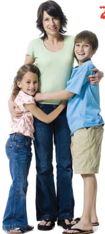
بنفسه ويخوض تجارب مماثلة بنجاح.

يمكننا النظر إلى الحياة من منظار وردي أو أسود حالك. نستطيع تقبل الأمور بإيجابية أو سلبية. لكن التفاؤل ليس هبة تولد معنا، بل طريقة تفكير نتعلمها.