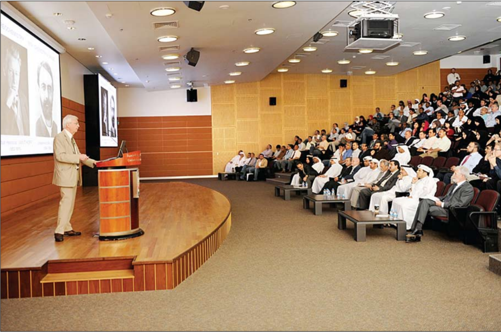
حضرها جمع من الأكاديميين والطلاب